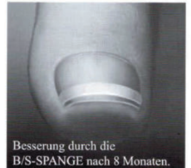
Besserung durch die B/S-SPANGE nach 8 Monaten.

Im Verlauf der Behandlung gibt's keine spürbaren Einschränkungen.