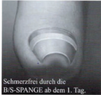
Schmerzfrei durch die B/S-SPANGE ab dem 1. Tag.

Am Anfang stehen der Schmerz und die Hoffnung auf Heilung.