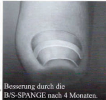
Besserung durch die B/S-SPANGE nach 4 Monaten.

„Die effiziente und perfekte Therapie! Eingewachsene Nägel formen und heilen geht mit der B/S-SPANGE vorbildlich leicht.“